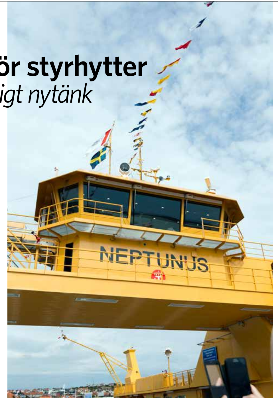
Hur framtidens styrhytter kommer se ut vet man inte idag. Här är Neptunus, ett exempel på en stor frigående färja.

– Vi vet knappt hur utrustningen kommer att se ut, om det blir konsoler, hur många skärmar det kommer finnas i hyt-