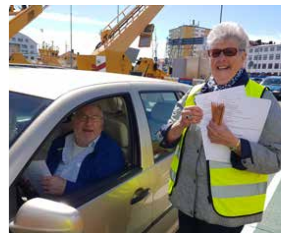
NKI på Aspöleden.