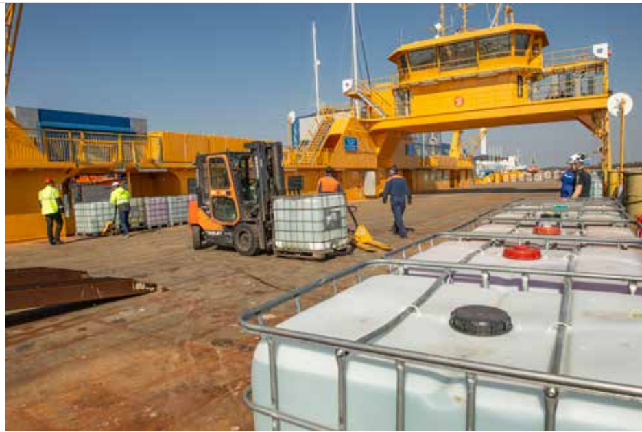
Ovan: Det var mycket bättre väder dagarna innan sjöprovet.