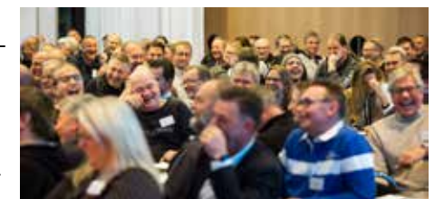
Bildtext: Så här kul hoppas vi att det blir även på årets rederidagar! Bilden är från förra gången vi samlades 2017.

Hälsoutmaningens vinnare kommer att presenteras och det blir som vanligt ett digert program, men också tillfälle att träffa och prata med kollegor från olika håll i landet. Mer information om vad programmet innehåller återkommer Sjövägen till längre fram.