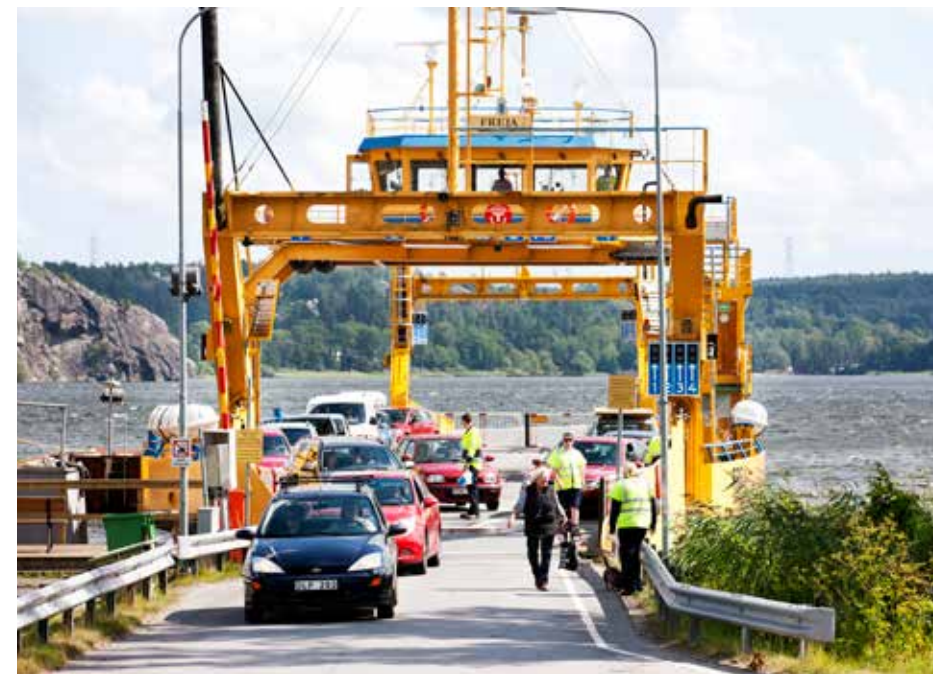
Snart ska resenärerna kunna betala biljetten med swish på Ekeröleden.