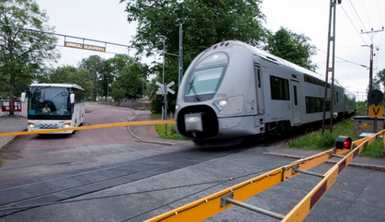
Plankorsning vid Groaplan.