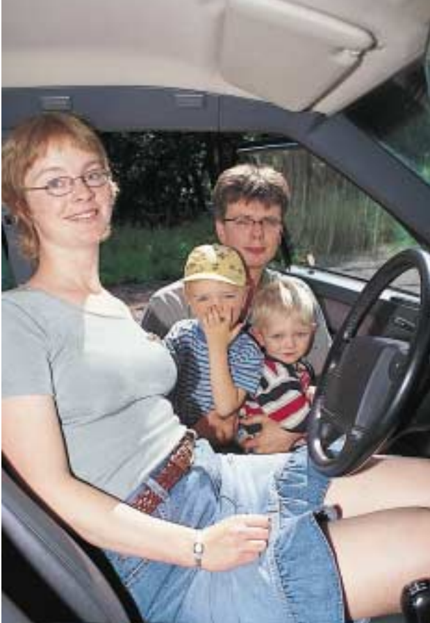
De privata testförarna tycker att ISA gör det lättare att hålla rätt hastighet.