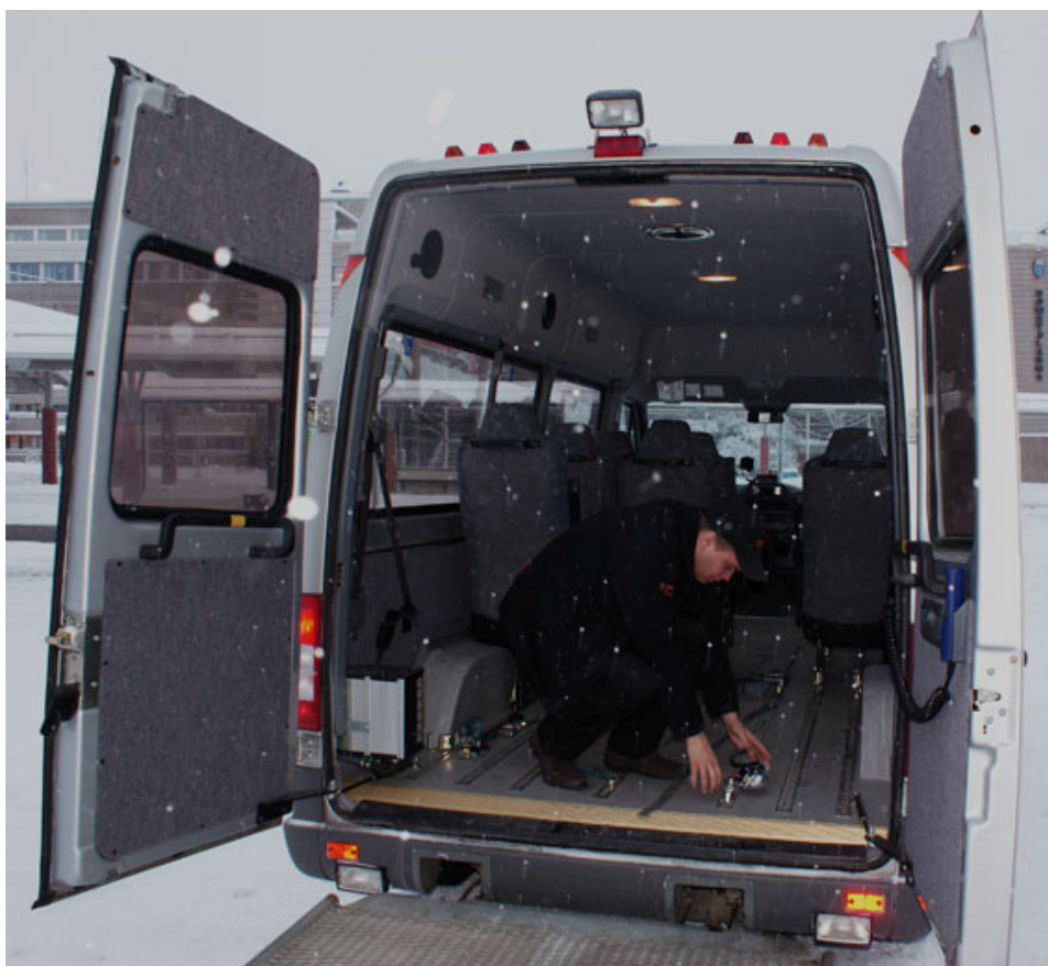
Bild 1. Interiör för ett specialfordon, föraren håller på att ta lös spännbanden från fästena på golvet sedan rullstolen har körts ut från fordonet..

De fordon som används inom färdtjänsten är dels vanliga taxibilar för transporter de flesta färdtjänstresenärer med lättare rörelsehinder och dels specialfordon, bild 1, för personer med större rörelsehinder som sitter i rullstol.