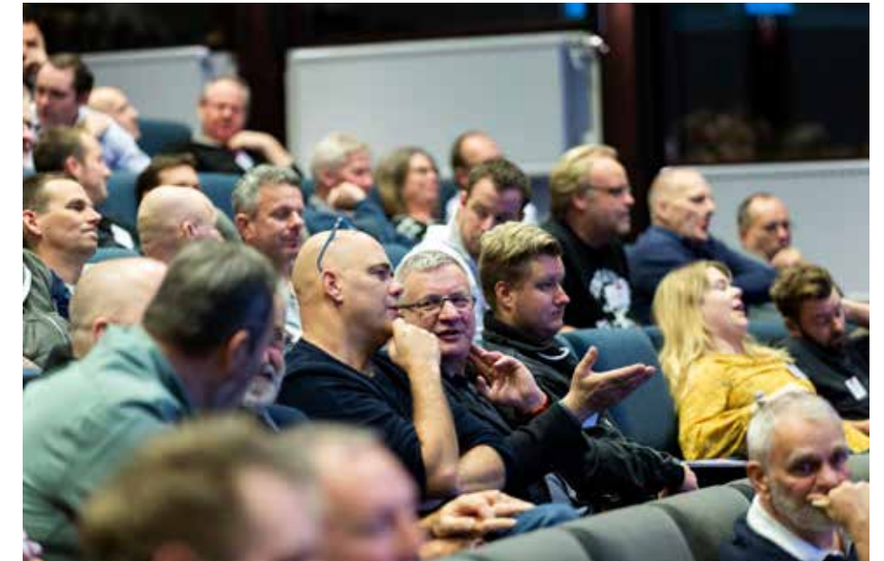
Ett hav av medarbetare, Rederidagarna 2019 på Arlanda.