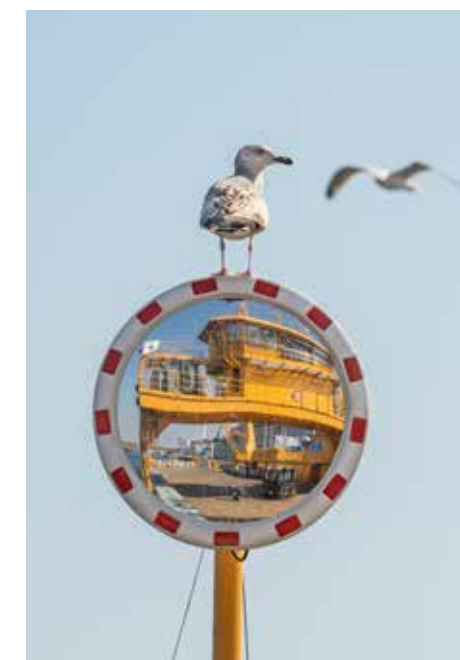
En gråtrut på besök på vägfärjan Tellus. Vi är dock fortsatt restriktiva mot besökare i styrhytten.