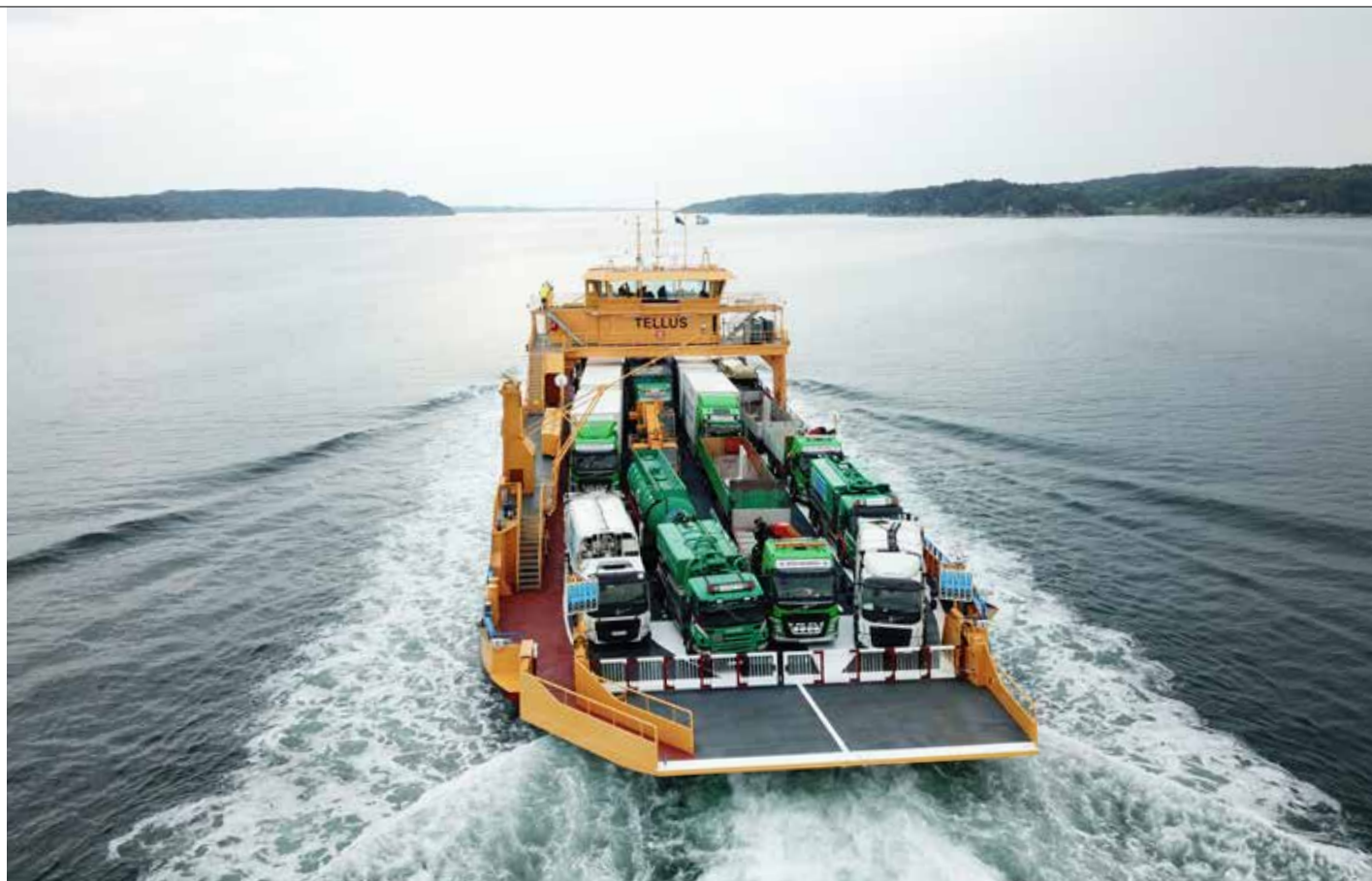
Tellus är vår första nya hybridfärja. Nu kartläggs behovet av en utbildning för smarta fartyg.