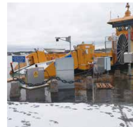
Stegeborgsleden var en av flera färjeleder som drabbades hårt av högt vattenstånd i februari.

Sjövägen återkommer när resultaten är klara. ⚡